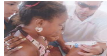
Prueba con el "Peak Flow".

El 4 de junio de 2005 se llevó a cabo del 3er Encuentro Familiar de la Alianza de Asma, en colaboración con la Asociación del Pulmón. Por tercera ocasión utilizamos las facilidades de Villa Nativa en Trujillo Alto. Asistieron aproximadamente 60 personas, entre niños del programa y sus padres. Se ofrecieron charlas educativas, el enfermero, realizó la prueba del Medidor de Flujo Máximo ("Peak Flow", a los niños participantes del programa. Hubo diversión jugando baloncesto y el chapuzón de la piscina que no podía faltar. Para cerrar con broche de oro, un riquísimo almuerzo. Adjunto fotos: